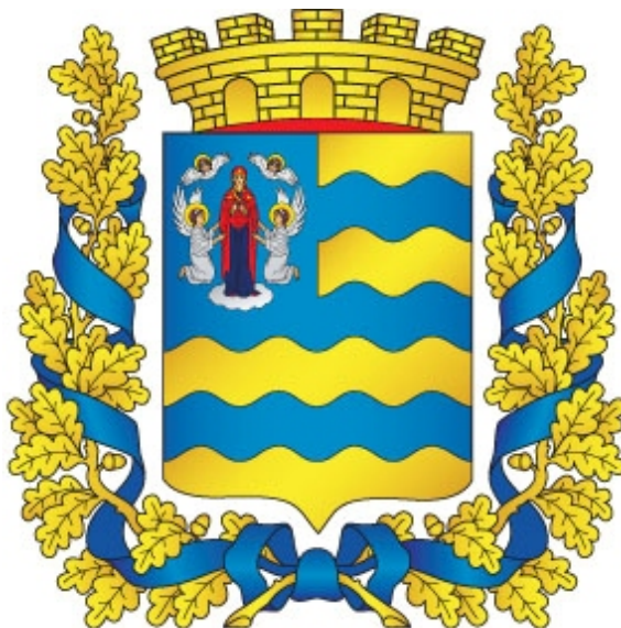
Изображение герба Минской области (цветное)

УТВЕРЖДЕНО Указ Президента Республики Беларусь 22.11.2007 № 595