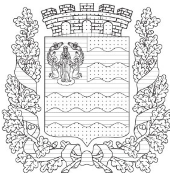
Изображение герба Минской области (с передачей цвета условной шафировкой)

УТВЕРЖДЕНО Указ Президента Республики Беларусь 22.11.2007 № 595